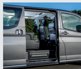
Puertas traseras laterales con apertura eléctrica