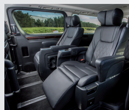
Segunda fila de asientos con regulación eléctrica y calefactores