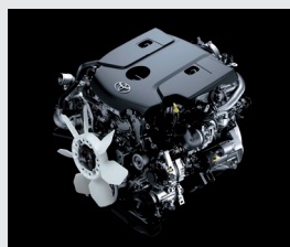
Motor 1GD (2.8l) - 163 CV

*Diésel con contenido de azufre menor a 10 ppm. **Toyota Safety Sense, integra diferentes sistemas de seguridad activa que pueden variar según cada modelo y/o versión. A su vez, estos sistemas están diseñados para asistir al conductor, no para sustituirlo. El conductor debe mantener en todo momento el control de su vehículo y es responsable de su conducción, por cuanto estos sistemas no reemplazan la conducción segura. El correcto funcionamiento del Toyota Safety Sense y de los distintos tipos de sistemas que equipa, depende de muchos factores incluyendo las condiciones del camino, el clima y el vehículo, razón por la cual el/los sistemas podrán verse afectados u obstaculizados debido a factores externos, no siendo Toyota Argentina S.A. responsable de las consecuencias derivadas del uso del sistema. Para más información sobre Toyota Safety Sense, dirigirse a la web toyota.com.ar o consulte el manual de usuario.