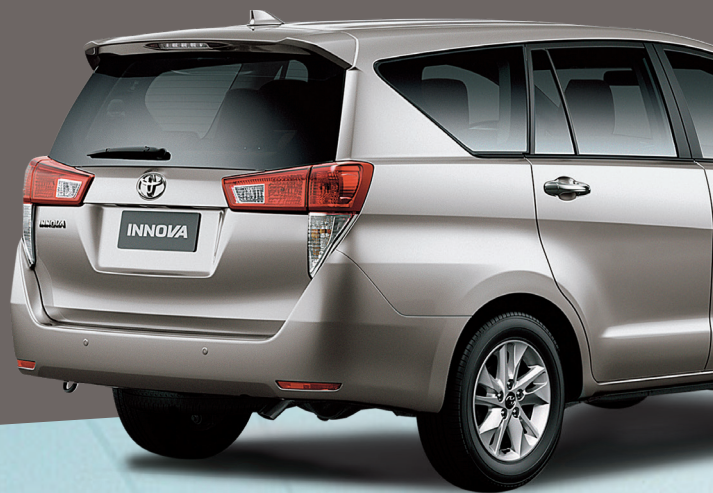
Imagen correspondiente a la versión SRV