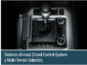
Sistema off-road (Crawl Control System y Multi-Terrain Selector).