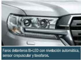
Faros delanteros Bi-LED con nivelación automática, sensor crepuscular y lavafaros.