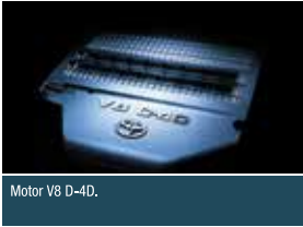
Motor V8 D-4D.