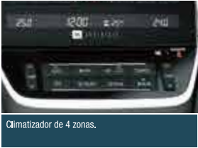
Climatizador de 4 zonas.